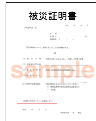
(被災時の住所確認)